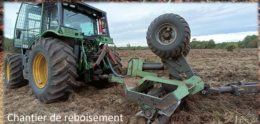
Chantier de reboisement